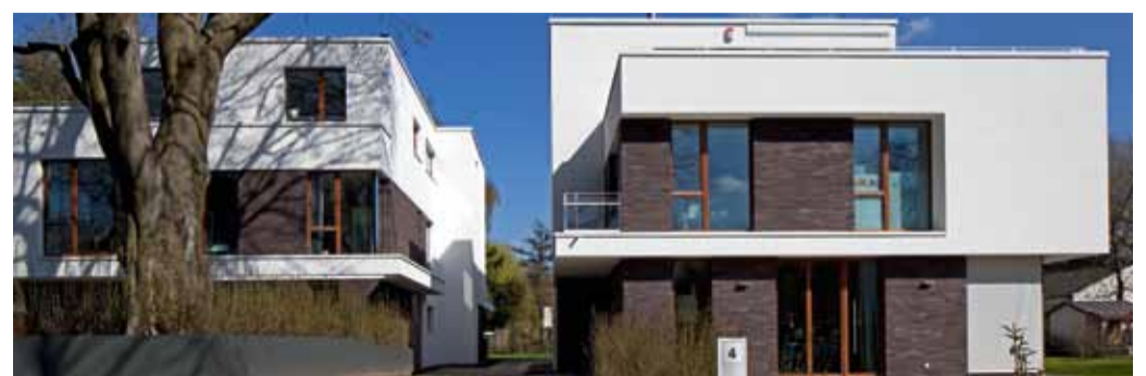
STADTVILLEN CORINTHSTRASSE, HAMBURG, DEUTSCHLAND

AUCH EINE FORM DER NACHVERDICHTUNG – UND DOCH SUGGERIERT DER WERTIGE EINDRUCK DES GEBÄUDEENSEMBLES DEN STATUS EINER EINZELVILLA