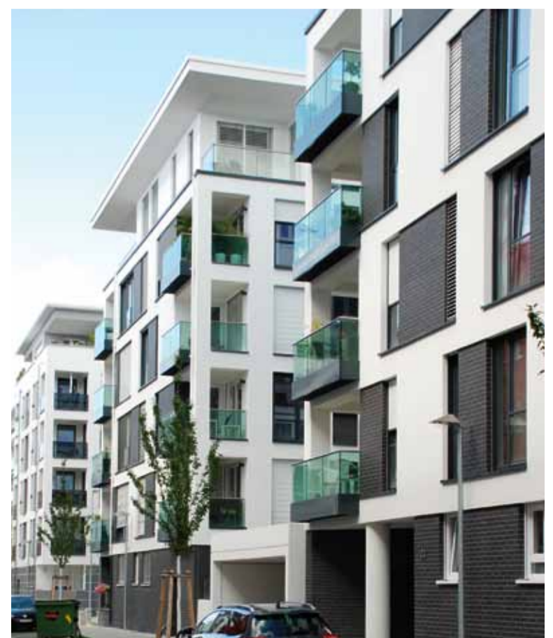
Bei den TerioTec® Terrassenplatten aus extrudierter Keramik waren die für den Kauf entscheidenden Produktmerkmale wie Lichtechtheit, Pflegeleichtigkeit, Maßhaltigkeit, Stabilität und die aus der 2-cm-Stärke resultierende Gewichts- und Preisersparnis ganz entscheidend.