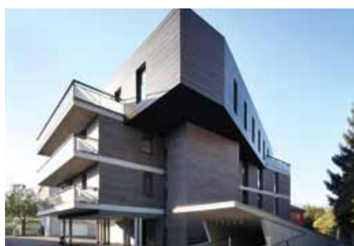
KLEINWOHNANLAGE KRAVOGL, INNSBRUCK, ÖSTERREICH

HOCHWERTIGE GEGENWARTS- ARCHITEKTUR MIT COSMO- POLITISCHEM MATERIALMIX