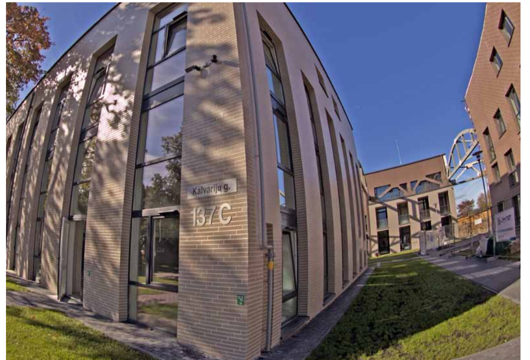
Die Umwandlung eines Industriegebiets in hochwertige Wohn-, Büro- und Grünflächenqualität wird in mehreren Stufen auf einer Fläche von ca. 4,5 ha entwickelt.

Lina Stasiukynienė von der Investmentgruppe Penki Kontinentai: „Wir freuen uns sehr über den großen Zuspruch und die Aufmerksamkeit, die wir mit den ‚Loft Stadt Smart Buildings‘ auch international erregen. Denn das ist das größte Kompliment für unsere litauische Variante von modernem, sicherem Wohnen.“ Mehr: http://www.youtube.com/watch?v=HZObcCv8wfc