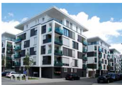
CITY PARK PARKVILLEN, KARLSRUHE, DEUTSCHLAND

DIFFERENZIERUNGSMERK- MALE FÜR HOCHWERTIGEN GESCHOSSWOHNBAU